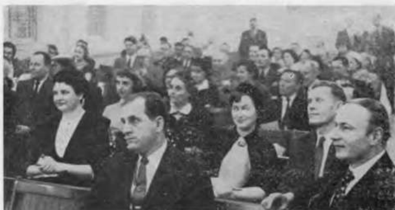
KARIO suruošto literatūros vakaro svečių dalis

Š. m. balandžio 7 d. "Karys" su-ruošė literatūros vakarą. Brooklyno Piliesių klubo salė prisipildė beveik pilnutėlė, tas maloniai nustebino rengėjus, rašytojus ir pačius svečius. Paprastai į tokios rūšies parengimus mažai lankomasi. Ir suprantama — mažai turima laiko lietuviškai knygai, kuri visada čia pat po ranka: kur čia žmogus gaisins laiką važiuoti parengimui ir tik dėl to, kad pamatyti kas toks, ką jis parašė ir dar nespausdino, arba spausdino, bet dar nepaskaitė. Tačiau tiesioginis kontaktas tarp rašytojo ir skaitytojo yra reikalingas, ne todėl, kad žinot, jog šitą knygą parašė Petras, aš jį pažįstu, o aną Veronika, aš ją girdėjau skaitant, bet tam, kad rašytojas, o bendrai paėmus kūrėjas, gautų jam priklausomą moralinį atlyginimą už jo pastangas, įdėtą darbą ir pasiaukojimą. Būtų naivu manyti, kad gauti centai kaip honoraras už leidinius ar kūrinius (jei jie iš viso yra gaunami) yra pakankamas kūrėjui atlyginimas. Literatūros vakarai ir sudaro sąlygas tiesioginiai pajusti iš klausytojų moralinį atlyginimą už kultūrinį įnašą, kas gal ir būtų dalis atpildo ir paskatinimas tolimesniam kultūriniam darbui.