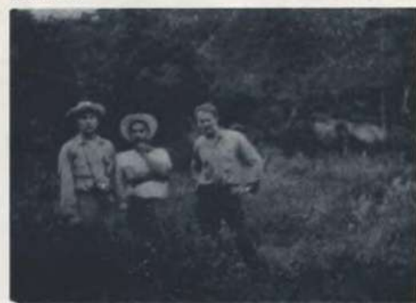
K A R I O S